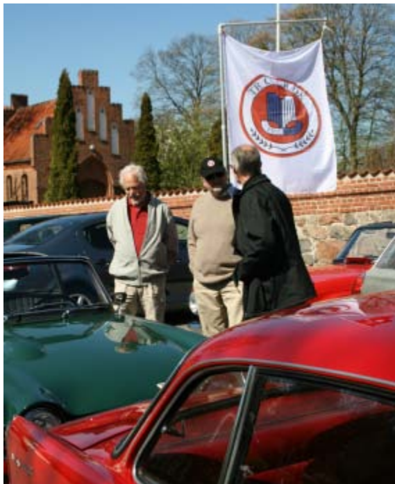
Stemningsbillede fra Generalforsamlingen